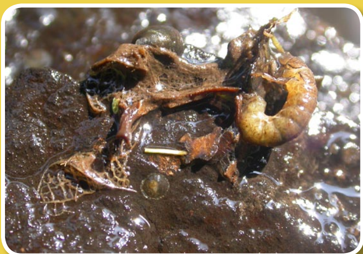
La larve et son piège

On les rencontre en eaux vives. Ces larves construisent un abri constitué le plus souvent de petits cailloux et d'un filet de soie qui retient le plancton emporté par le courant.