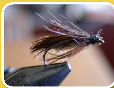
Exemple de mouches confectionnées par un pêcheur pour capturer des truites