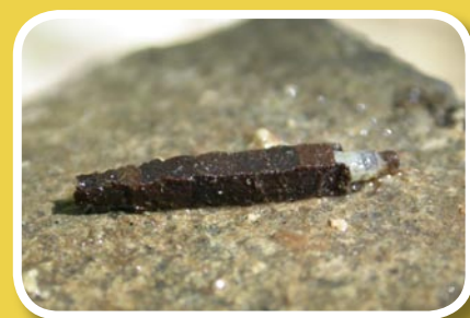
Différentes larves de trichoptères à fourreau ou porte bois