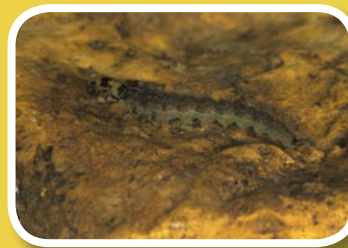
Exemple de larve sans fourreau et errantes