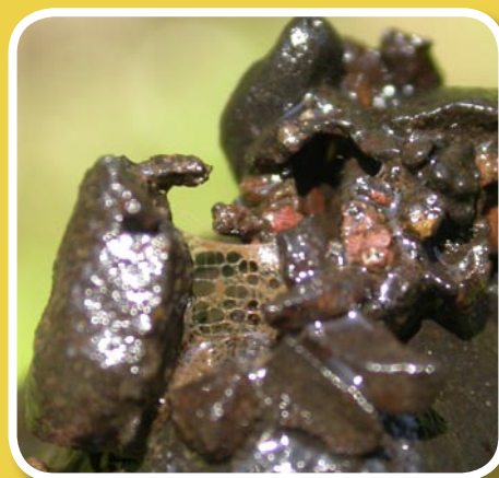
Détail du piège