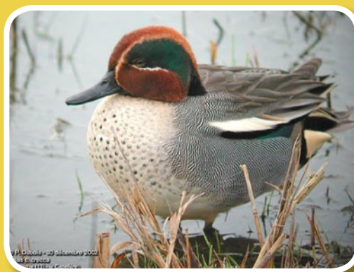
Mâle de sarcelle