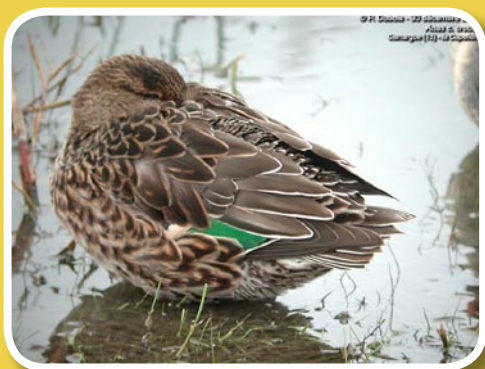
Femelle de sarcelle

La Sarcelle d'hiver est le plus petit canard d'eau douce d'Europe. Son plumage nuptial est très attrayant : la tête est rousse avec une large bande verte sur les joues. La poitrine est crème tachetée de noirâtre, prolongée par un ventre blanc et un dessous de la queue jaune bordé de noir. Le dessus du corps et les flancs adoptent une coloration grise. Les ailes sont marquées par une fine bande blanche sur leur avant et par un miroir noir et vert sur la partie centrale. Le reste de l'année, après la mue, le mâle porte des couleurs assez ternes comme la femelle. Il est entièrement brun et beige.