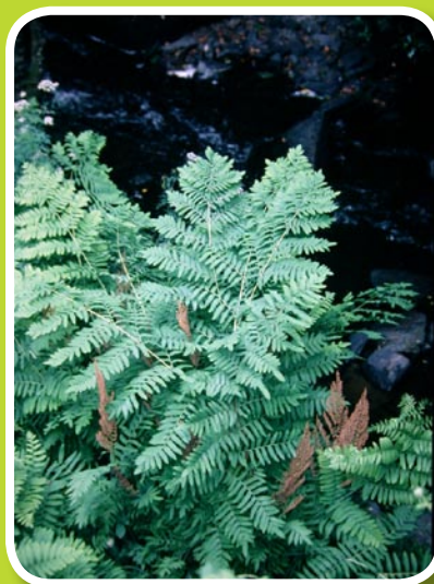
Feuilles et frondes fertiles d'osmonde royale

Racines diurétiques, astringentes et toniques.