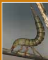
Une larve de dytique et un aperçu de ce qui attend sa proie...