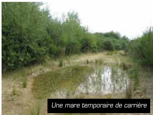
Une mare temporaire de carrière

Il n'y a pas une mare mais des centaines de mares ! Chacune possède ses propres caractéristiques. On peut quand même s'accorder sur le fait que pour toutes la profondeur ne dépasse généralement pas le mètre. Ensuite, plusieurs détails feront que la vie qui va s'y développer ne sera pas la même.