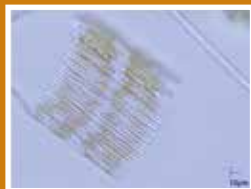
Une diatomée (phytoplancton)

Certains crustacés planctoniques tels que les daphnies et les cyclops sont visibles à l'œil nu !