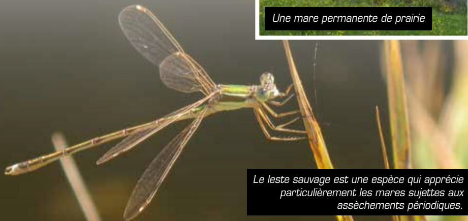
Le leste sauvage est une espèce qui apprécie particulièrement les mares sujettes aux assèchements périodiques.