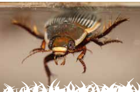
Une femelle de dytique bordé qui vient respirer à la surface. Remarquez le dos strié et comparez avec le mâle (couverture).