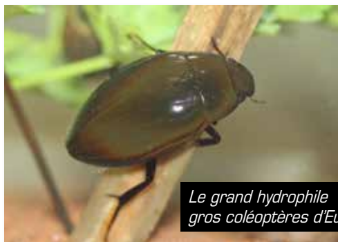
Le grand hydrophile est l'un des plus gros coléoptères d'Europe.

Le petit hydrophile est une version miniature (2cm max) de son grand cousin, en moins ovale. Il est également bien plus commun. Les deux possèdent une forte épine le long de la face ventrale.