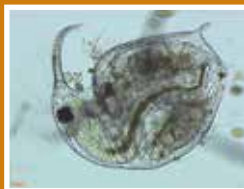
Une daphnie (zooplancton)