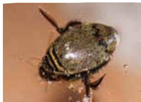
Accouplement d' acilies à la surface (la femelle est en dessous).

Les dytiques sont de redoutables prédateurs, notamment les plus gros. Tout les intéresse : larves d'insectes, têtards, petites grenouilles, tritons, petits poissons... Et il y a pire ! Leurs larves sont encore plus voraces. Celles-ci ne leur ressemblent pas du tout (voir photo) et impressionnent avec leurs mâchoires acérées. Pour devenir adultes, elles quittent l'eau après plusieurs mues et creuse une loge dans la vase de la berge. Elles s'enferment alors dans une sorte de coque qu'elles fabriquent et en sortiront métamorphosées quelques semaines plus tard.