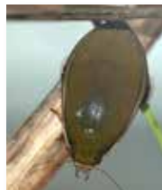
...et le cybister , un gros « ballon de rugby »!