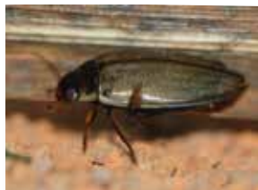
Le colymbète , un dytique de taille moyenne...