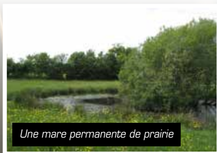
Une mare permanente de prairie