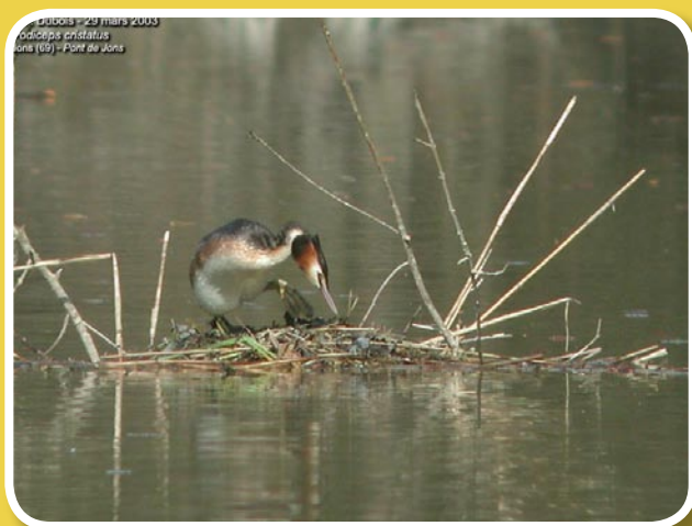
Le grèbe sur son nid

Nidification : Nid : Le couple construit sur l'eau une plate-forme de roseaux qui flotte et s'ancre aux plantes voisines ou prend assise sur le fond. Ponte : La femelle pond d'avril à juillet 3 à 5 oeufs blanchâtres. Incubation d'environ 28 jours par les deux parents. Les jeunes quittent le nid dès l'éclosion ; ils nagent et se perchent sur le dos des parents ; ils sont indépendants à l'âge de 2 ou 3 mois.