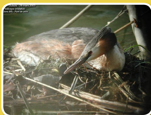
Le grèbe sur son nid