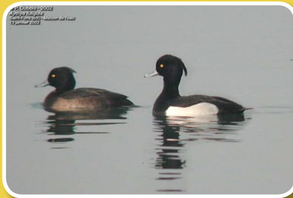
Couple de fuligule morillon

Chant : Le fuligule morillon émet une variété de cris rauques.