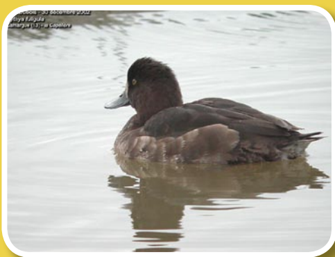
Femelle de fuligule morillon

Canard de petite taille avec un plumage contrasté, une crête noire proéminente, un oeil doré et un bec clair noir et blanc au bout. La femelle a un plumage brun dessus et brun plus clair dessous, un bec et des yeux de même couleur mais sa crête est plus courte. On note parfois une tache blanche à la base du bec. En vol, les deux sexes montrent une barre alaire blanche.