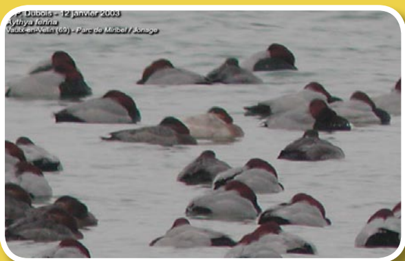
Fuligule milouin en groupe

Nidification : son nid est fait d'herbes et de feuilles ; il est dissimulé au sol près de l'eau. Ponte : La femelle pond de 8 à 10 oeufs verdâtres en avril-mai.