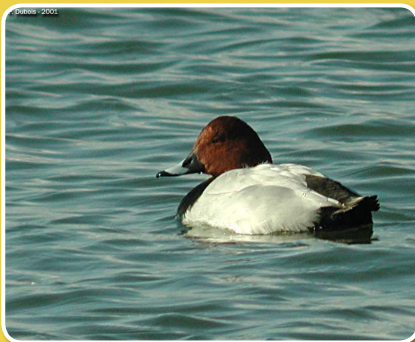
Mâle de fuligule milouin

Le mâle fuligule milouin a un plumage coloré, orange rougeâtre sur la tête et le cou, noir sur la poitrine et gris pâle sur le dos. Son bec proéminent est traversé par une bande grise au milieu. Le plumage de la femelle est moucheté de gris-brun, avec des marques gris clair sur le dos et une zone claire autour des yeux. En vol, elle est plus claire dessous alors que le mâle a la poitrine noire et le ventre blanc.