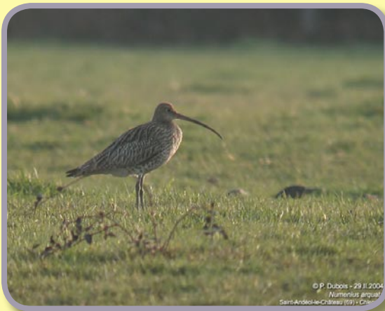
Le courlis dans son habitat d'été, la prairie

On peut le décrire comme le plus grand limicole. On le reconnaît grâce à son bec incurvé vers le bas. Son plumage est beige taché de brun sur le dessus. Le dessous est blanc rayé de brun, le bas-ventre d'un blanc immaculé. La mandibule inférieure de son bec se colore de rose en hiver. Ses longues pattes sont gris-bleu, terminées par 4 doigts, c'est un marcheur. La femelle du courlis cendré est plus grande et a un bec plus long que celui du mâle.