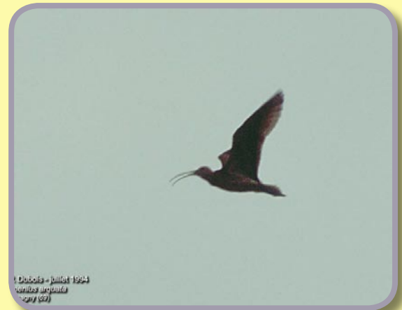
Le courlis en vol