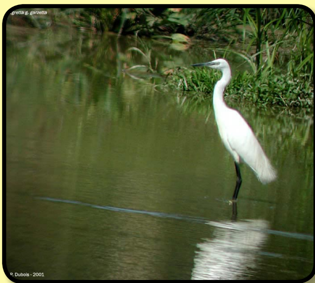
L'aigrette et son plumage blanc