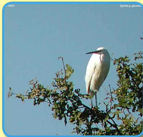
L'aigrette niche dans les arbres

Au bout de 3 semaines, les jeunes commencent à s'aventurer hors du nid et à 5 semaines ils prennent leur premier envol avec leurs parents.